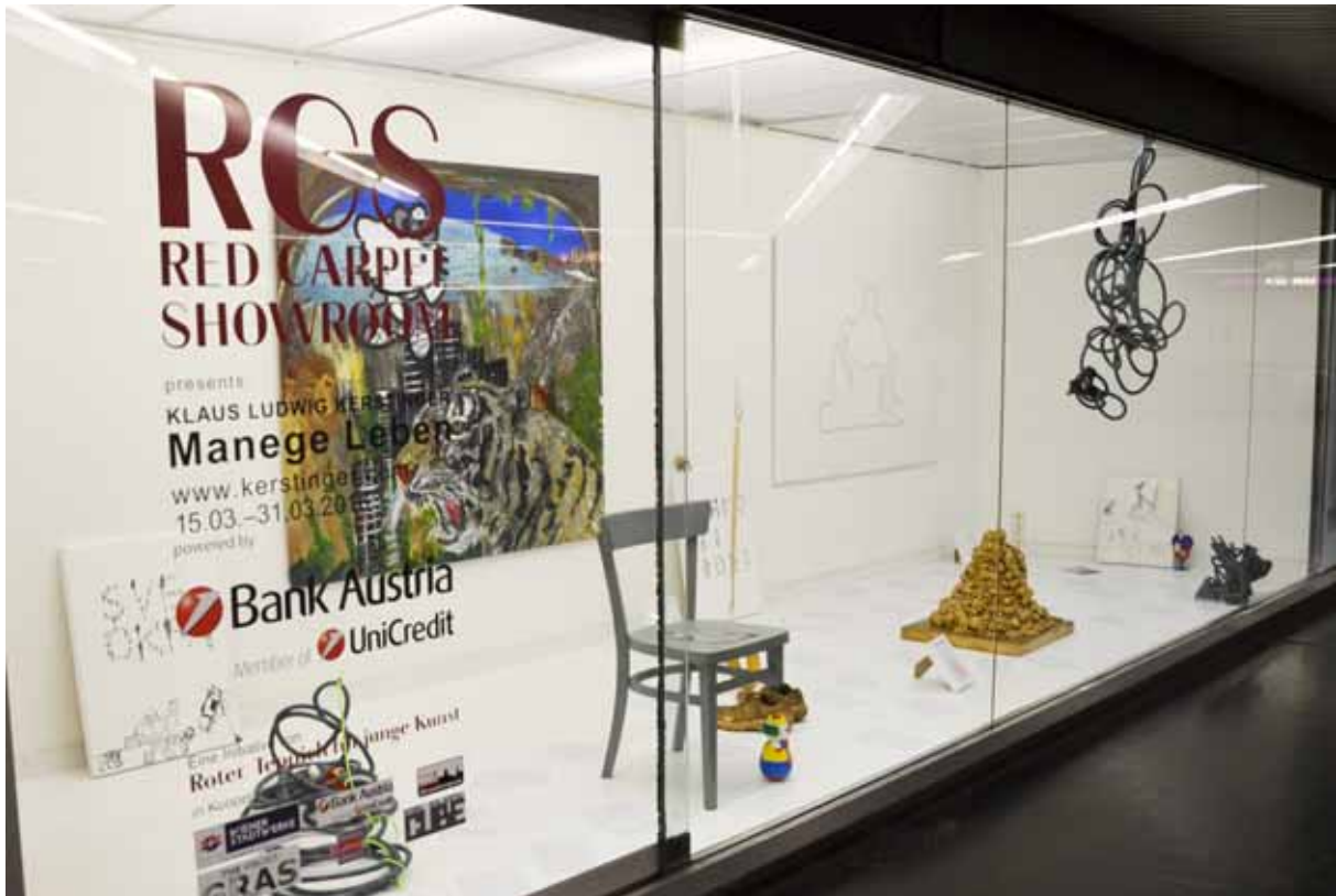
Klaus Ludwig Kerstinger