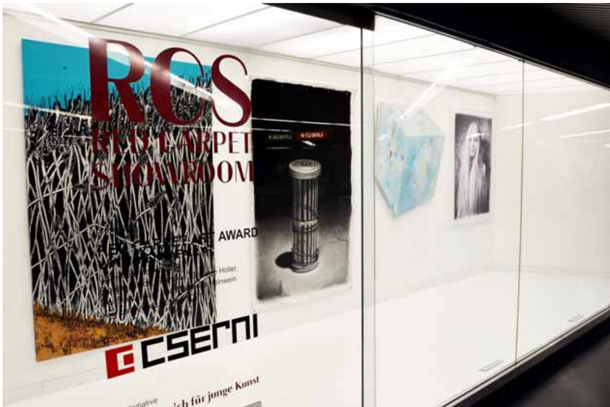
Red Carpet Art Award – Groupshow