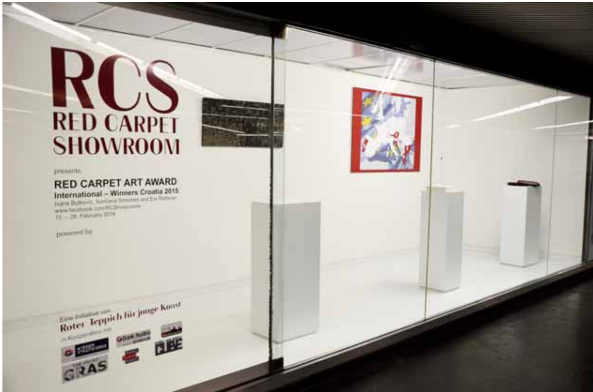
Red Carpet International Preview