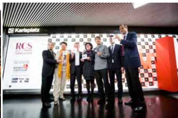
Eröffnung im Rahmen der Ausstellung HUMAN