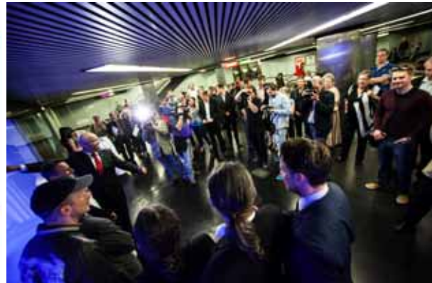
Feierliche Eröffnung im Mai 2013 durch Landtagspräsidenten Ernst Woller und Landtagspräsidenten a.D. Harry Kopietz