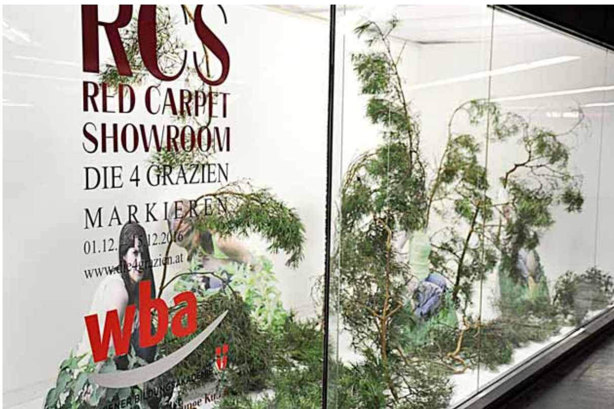
Die vier Grazien