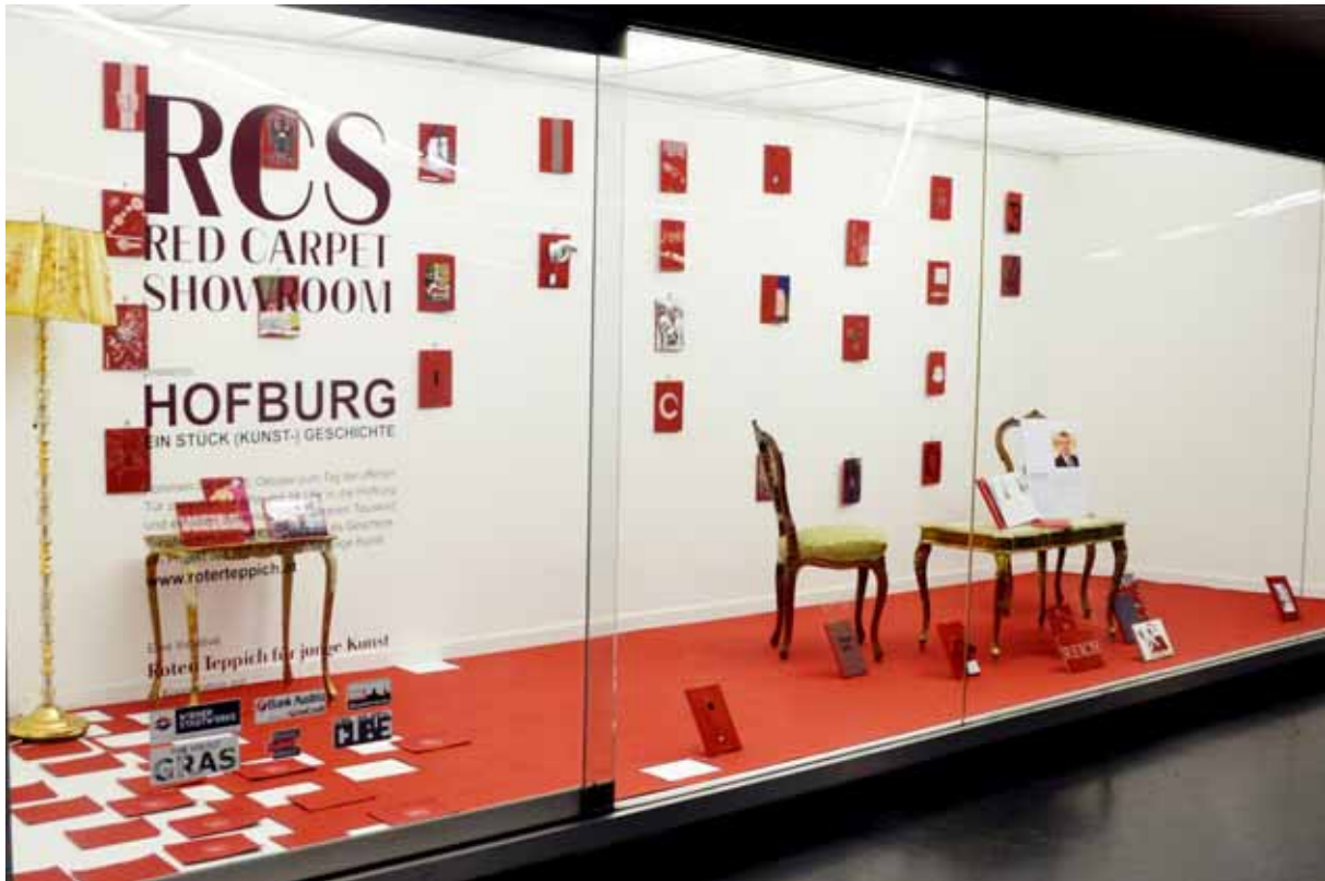
Hofburg – Ein Stück Kunstgeschichte